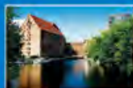
Medical Park Berlin