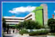
Stadl. Krankenhaus München-Bogenhausen