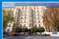
Hospital Thalkirchner Straße