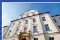
Krankenhaus München Harlaching