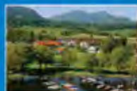
Medical Park Chiemsee