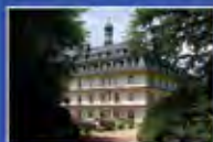
Max Grundig Klinik GmbH

Адрес: Мирали Гашгай, 93 Баку-Азербайджан www.europehealth.az