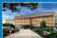
Medical Park Bad Camberg