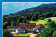
Medical Park Lohr